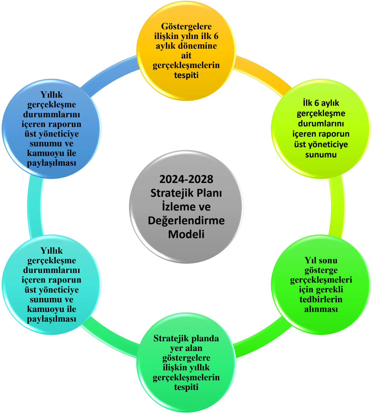
Şekil 2: İzleme ve Değerlendirme Modeli